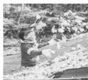
落ち葉の楽しさを味わう