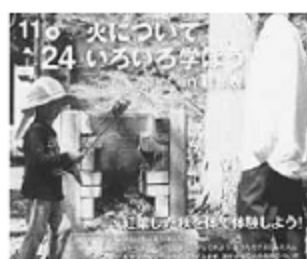
自分たちで火をおこし 火について学ぶ

参加者は自分で火をつけることができ嬉しかったと話していました。自然の楽しさを参加者同士で楽しみ、終了後も自然の中で交流したことで今後のつながりになりました。