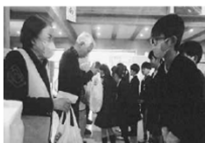
交通安全ボランティアさんへお礼

学級園・プランターを活用して花の栽培活動を行い、自主的な花いっぱい運動につなげられました。