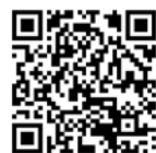
事前ボランティア登録QRコード

これは自然災害（地震、台風、豪雨等）の発生に備え、平常時から町内外の各関係機関団体と災害発生時の動きを確認するとともに、発災時に被災者の生活と、一日も早い生活再建を支援するため、「共助」の被災者生活サポートボランティア活動（＝災害ボランティア活動）をすすめるためのものです。