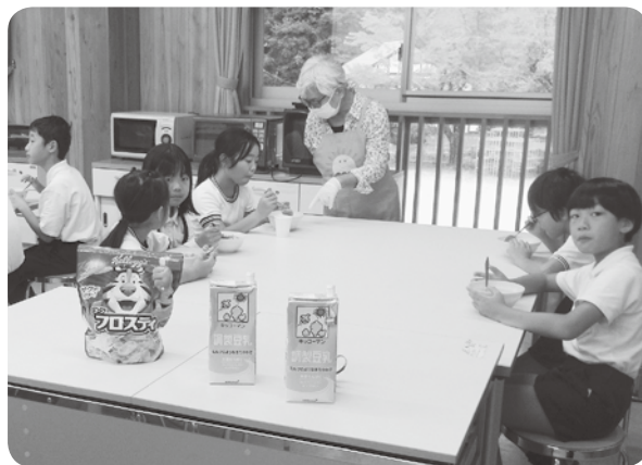
朝8:15～8:30 メニュー コーンフレークと豆乳(プレーン)

今後は、来年3月まで毎月行う計画で、児童の朝ごはんに対する意識変化などを確認します。必要に応じて、町内全域での実施を検討します。