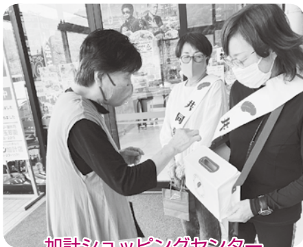
加計ショッピングセンター