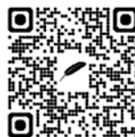
赤い羽根共同募金QRコード