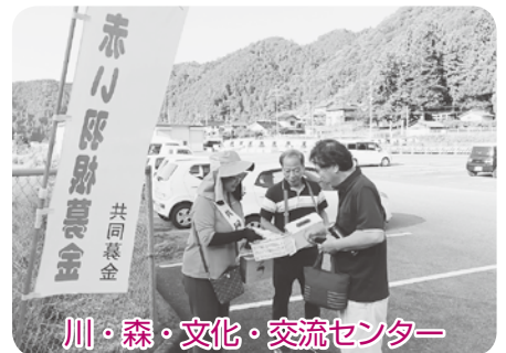
川・森・文化・交流センター