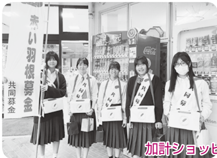
加計ショッピングセンター