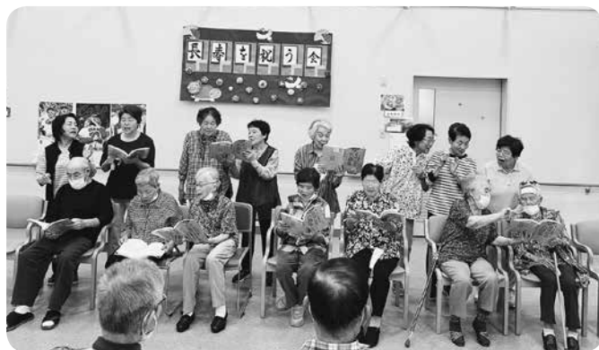
サロンのみなさんと合唱